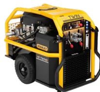
Unidad potencia 2 salidas HP28