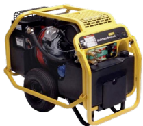
Unidad potencia 1 salida GT18